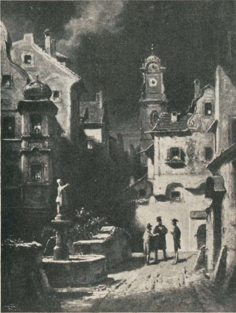
C. Spitzweg: „Disput im Mondenschein“ aus dem Buch: „Kleine Kunstgeschichte Europas“ von H. Weigert erschienen im Kohlhammerverlag